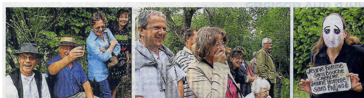
La Compagnie Madame Suzie a proposé une balade spectacle de deux heures avec des étapes hilarantes, musicales, surréalistes et poétiques...